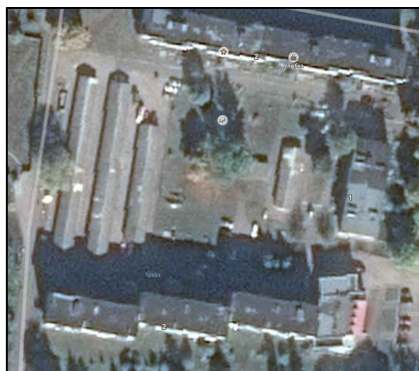
Рисунок 1 – Объект проектирования (снимок со спутника)

Объект благоустройства – придомовая территория пятиэтажного панельного жилого дома (рисунок 1). Расположен в поселке Марьино Ивановского сельсовета Рыльского района Курской области, по улице Сироткина. Объект проектирования в градостроительной ситуации поселка Марьино находится в его центральной части.